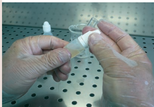
Cerramos el envase.