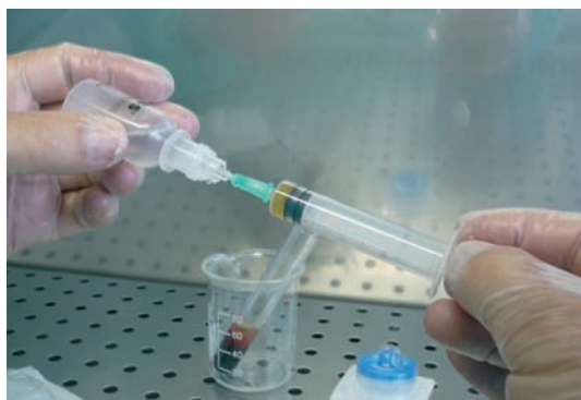
Introducimos directamente la jeringa en la solución salina BSS.