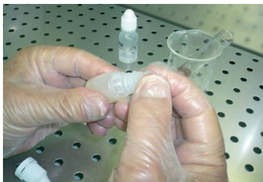
Ponemos en el envase el obturador para goteo.