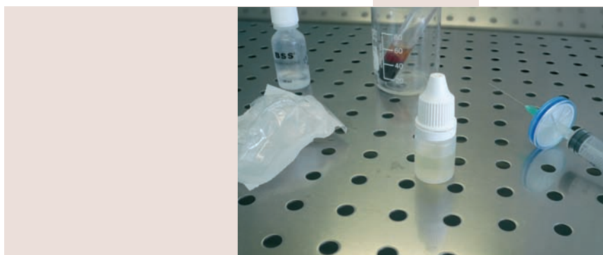
Aspecto final del colirio de suero autólogo.