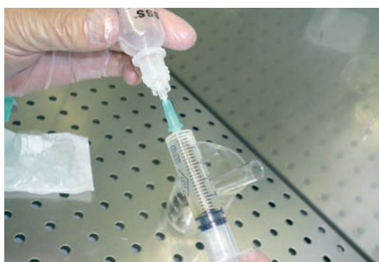
Colocamos el filtro de esterilización de 0,22 \mu en la jeringa.