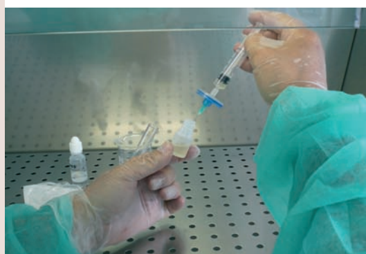
Trasvasamos el suero autólogo de la jeringa al envase para colirios.