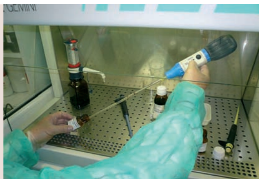
Succionamos hasta obtener un volumen final de 5 ml.